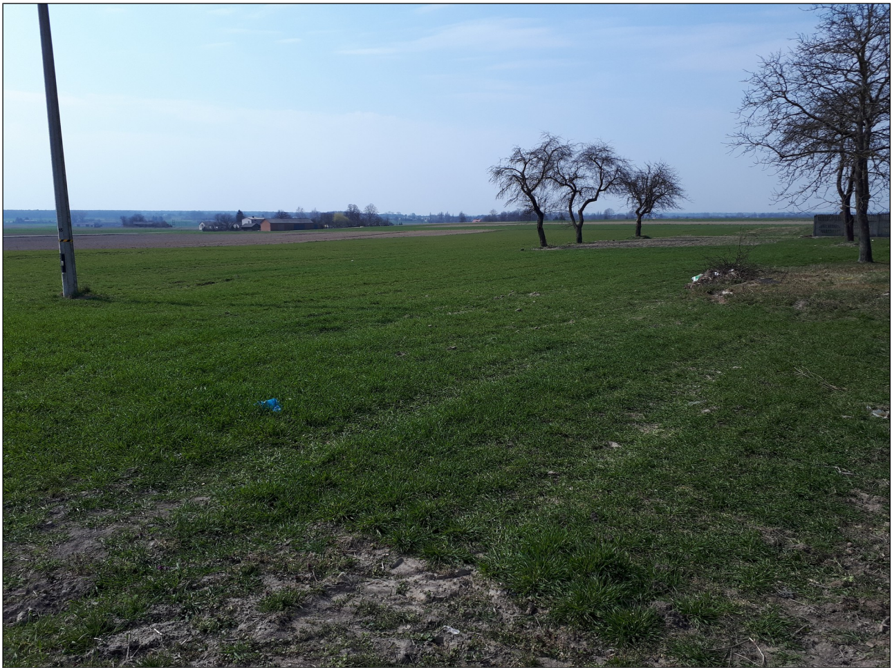
fot. 1 Działka Nr 224/19, następnie po lewej działka Nr 224/16, widok w kierunku zachodnim