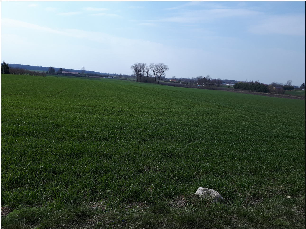
fot. 1 Działka Nr 866, widok w kierunku zachodnim